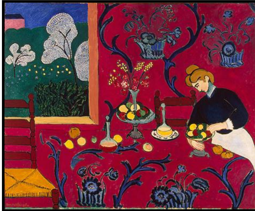
fig. 1: The Red Room

Manakala dalam karya Andre Derain bertajuk “London Brige” sama sekali menolak elemen keharmonian. Perspektif dalam karyanya salah, tidak sebenar dan penggunaan warna yang tidak semulajadi. Beliau beranggapan dan menimbulkan konsep baru iaitu warna tidak lagi berfungsi untuk menggambarkan ton pada objek tetapi lebih merupakan persembahan emosi.