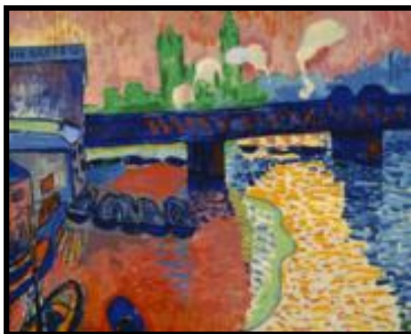
fig. 2: London Brige

Manakala dalam karya Andre Derain bertajuk “London Brige” sama sekali menolak elemen keharmonian. Perspektif dalam karyanya salah, tidak sebenar dan penggunaan warna yang tidak semulajadi. Beliau beranggapan dan menimbulkan konsep baru iaitu warna tidak lagi berfungsi untuk menggambarkan ton pada objek tetapi lebih merupakan persembahan emosi.