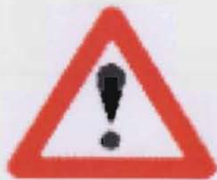
Figura 6 Simbol

Semiotik juga merupakan kajian ilmu makna, bahasa (linguistik), kajian kesusasteraan yang mengandungi bentuk maksud, tanda (sign) dan simbol serta bagaimana kita hendak gunakan atau lambangkan. (Rujuk figura 6-8) Selain itu, semiotik merupakan kajian tentang ikonografi (paparan sesuatu subjek dalam bentuk gambar), ikonologi (cabang ilmu imej) dan tipologi (kajian atau pesanan atau klasifikasi jenis-jenis sistematik)