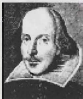
Figura 7 Ikon