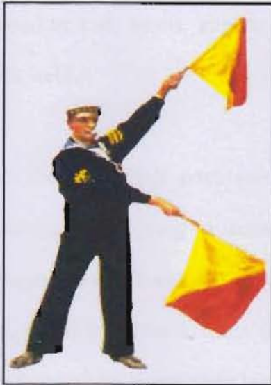
Figura 9 Isyarat Bahasa