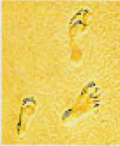
Figura 8 Indeks