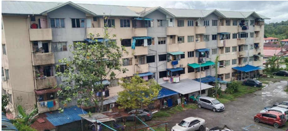
Flat Sungai Plan, Bintulu