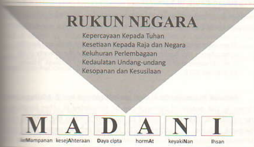
Gambar 17.2: Konsep Madani yang Bertunjangkan Rukun Negara

Rukun Negara telah dijadikan asas kerukunan hidup masyarakat Madani kerana ia juga menuntut permuafakatan dan perpaduan. Lima jalur merah dalam logo Malaysia Madani merupakan simbolisme kepada Rukun Negara. Rukun Negara digubal sebagai falsafah, etika dan ideologi (doktrin) negara dan sebagai satu bentuk garis panduan dalam membina masyarakat yang bersatu padu, adil dan harmoni. Maka, adalah wajar setiap rakyat memahami latar belakang, objektif dan prinsip Rukun Negara itu untuk perpaduan kaum yang lebih utuh dan kental. Lima objektif utama masyarakat Madani adalah untuk: (1) mencapai perpaduan, (2) memelihara cara hidup demokratik, (3) melahirkan masyarakat yang adil supaya kemakmuran negara dapat dinikmati bersama secara adil dan saksama, (4) membentuk sikap yang liberal terhadap tradisi kebudayaan yang pelbagai corak dan (5) membina sebuah masyarakat progresif dengan menggunakan sains dan teknologi moden.