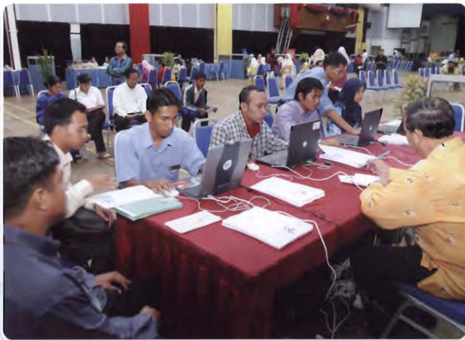
Temuduga sedang dijalankan

Turut hadir semasa majlis perasmian ialah TNC HEP, Pendaftar, Pengarah Jabatan Tenaga Kerja Sarawak, Pengarah RTM Sarawak, ketua-ketua jabatan, wakil agensi yang mengambil bahagian, dekan-dekan dan pegawai-pegawai Unimas.