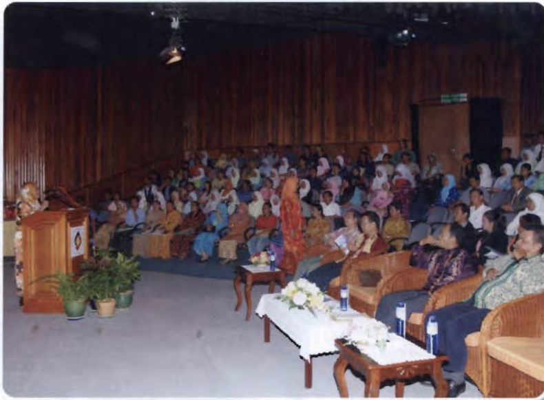
Majlis Perasmian di Panggung Eksperimen