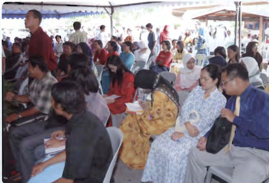
Para calon sedang menunggu giliran