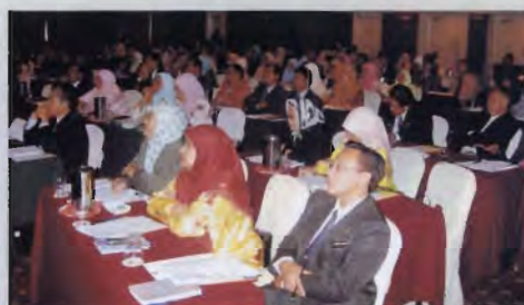
Sebahagian daripada peserta