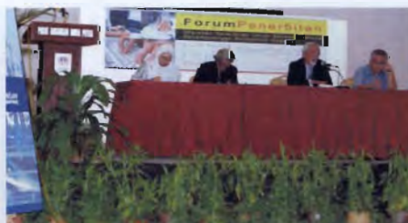
Forum penerbitan juga diadakan