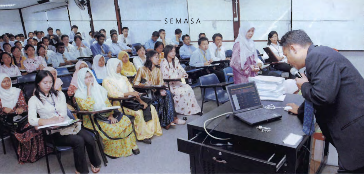
Pelajar sedang mendengar taklimat