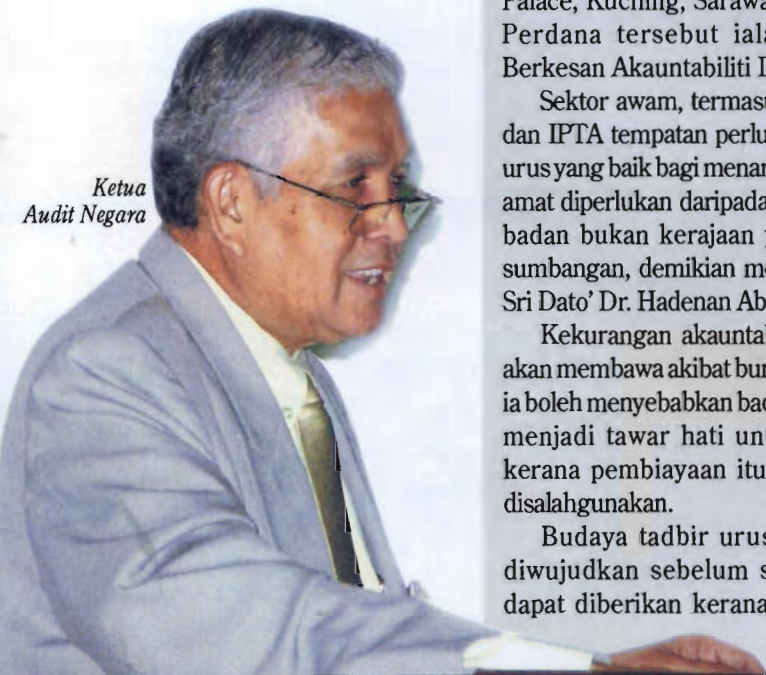
Ketua Audit Negara