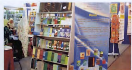
Buku terbitan Unimas