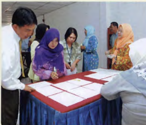
Pendaftaran ahli-ahli koperasi

Koperasi Unimas Berhad telah mengadakan Mesyuarat Agung Tahunan Ke-2 di Dewan Kuliah 1 jam 2.30 petang. Antara agenda mesyuarat ialah membenteng dan mengesahkan Minit Mesyuarat Agung Pertama dan Mesyuarat Agung Khas. Semua ahli dijemput bagi menghadiri mesyuarat tersebut dan bagi sesiapa yang hadir telah diberi baucer RM10.00 dan berpeluang untuk memenangi hadiah cabutan bertuah.