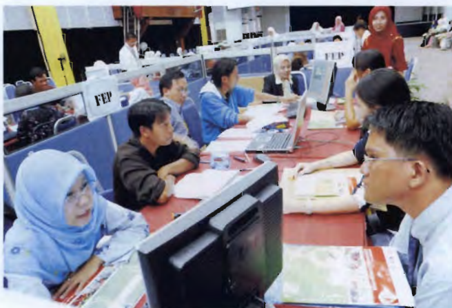
Pendaftaran pelajar di fakulti

Pelajar baru juga dikehendaki untuk mengikuti Minggu Orientasi selama seminggu bermula pada 3 - 9 Julai 2005. Antara atur cara yang disusun sepanjang program tersebut ialah taklimat Majlis Perwakilan Pelajar dan taklimat mengenai aktiviti senggang, aktiviti bersama fakulti, aktiviti kebudayaan dan acara sukaneka. Tujuan diadakan minggu orientasi adalah bagi mendedahkan suasana pembelajaran di Unimas kepada pelajar baru disamping dapat mengeratkan hubungan silaturahim dan memupuk semangat kerjasama antara pelajar yang berbilang kaum.