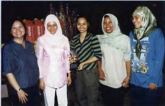
Pasukan Unimas B Wanita muncul juara boling Piala Dato Azman.