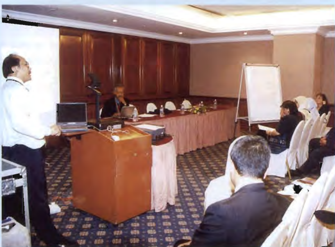
Among the participants at the conference.