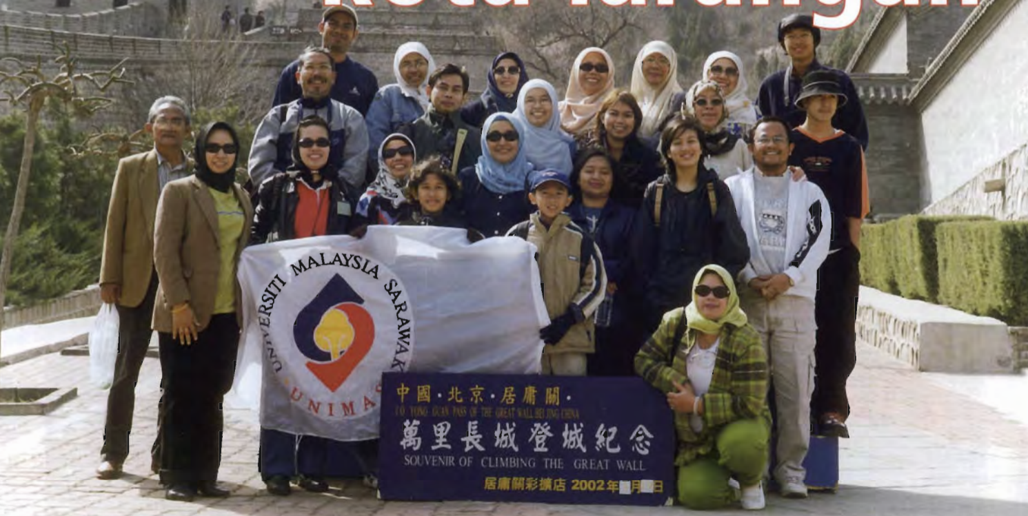
Rombongan MASNITA bergambar kenangan di Tembok Besar China.

Jauh perjalanan luas pemandangan. Pepatah Melayu itulah yang menjadi inspirasi kepada Persatuan Wanita untuk Staf dan Isteri Staf Unimas (MASNITA) untuk menganjurkan lawatan ke Beijing China. Lawatan dengan kerjasama MASNITA dan TM Travel & Tours Kuala Lumpur bertolak ke Beijing dari Kuala Lumpur pada 17 Mac lalu ber-sama-sama dengan 24 orang peserta.