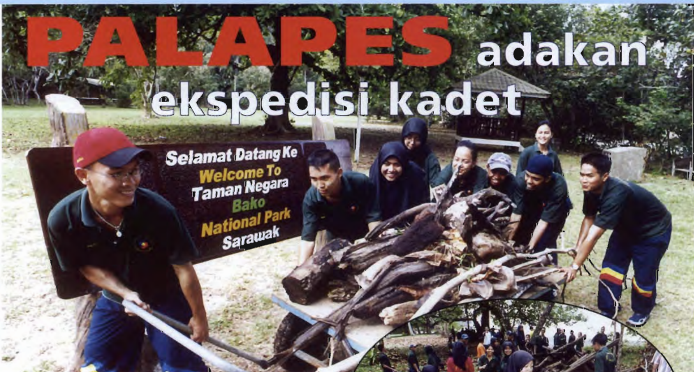
Semangat kerjasama boleh dijalin melalui kerja-kerja bergotong royong.

Separang perjalanan balik ke Kuching suasana begitu meriah dengan kisah tawar-menawar di Tebedu dan kegelian melihat ulat sagu yang menjadi makanan sebahagian kaum di Sarawak. Setibanya di Unimas mereka berkemas untuk berangkat balik pada kira-kira pukul 5.30 petang. Lawatan tiga hari di Sarawak akan tetap menjadi kenangan indah dalam lipatan memori mereka.