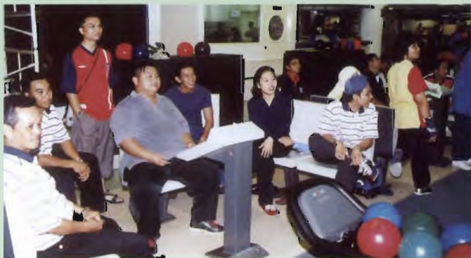
Sebahagian staf yang mengambil bahagian dalam acara boling Piala Kaim di Crystal Bowl.