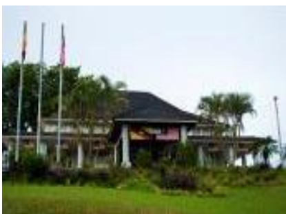
Gambar 2 ini merupakan pejabat Daerah Saratok sekarang yang terletak kira-kira 200 meter dari bangunan asal yang telah dirasmikan pada 30 Ogos 2009 di atas tanah Lot 42 Saratok Town District.

Berdasarkan Portal Rasmi Bahagian Betong (2016), pejabat Daerah Saratok dahulunya dikenali sebagai “Fort Charles” yang dibina oleh seorang kakitangan Kerajaan Brooke iaitu Maxwell pada tahun 1878. Daerah saratok ini terletak di tengah-tengah pusat Bandar Saratok iaitu di atas bukit Segatok yang merupakan bangunan bersejarah di Daerah Saratok. Pejabat Daerah Saratok telah beroperasi sebelum Merdeka lagi iaitu sekitar tahun 1888 sehingga tahun 2008 di Bangunan yang sama.