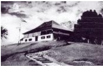
Gambar 1 : pejabat Daerah Saratok lama

Berdasarkan Portal Rasmi Bahagian Betong (2016), pejabat Daerah Saratok dahulunya dikenali sebagai “Fort Charles” yang dibina oleh seorang kakitangan Kerajaan Brooke iaitu Maxwell pada tahun 1878. Daerah saratok ini terletak di tengah-tengah pusat Bandar Saratok iaitu di atas bukit Segatok yang merupakan bangunan bersejarah di Daerah Saratok. Pejabat Daerah Saratok telah beroperasi sebelum Merdeka lagi iaitu sekitar tahun 1888 sehingga tahun 2008 di Bangunan yang sama.