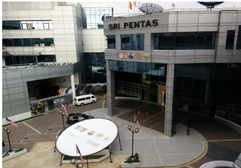
Gambar 1.2 Lokasi Kawasan Kajian