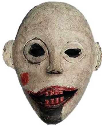
Gambar 1.1: contoh topeng orang Iban, indai guru