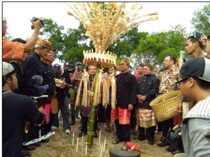
Gambar 1.2 : Antara upacara ritual Kaul (2017) yang menggunakan serahang kakan sebagai medium untuk persembahan.