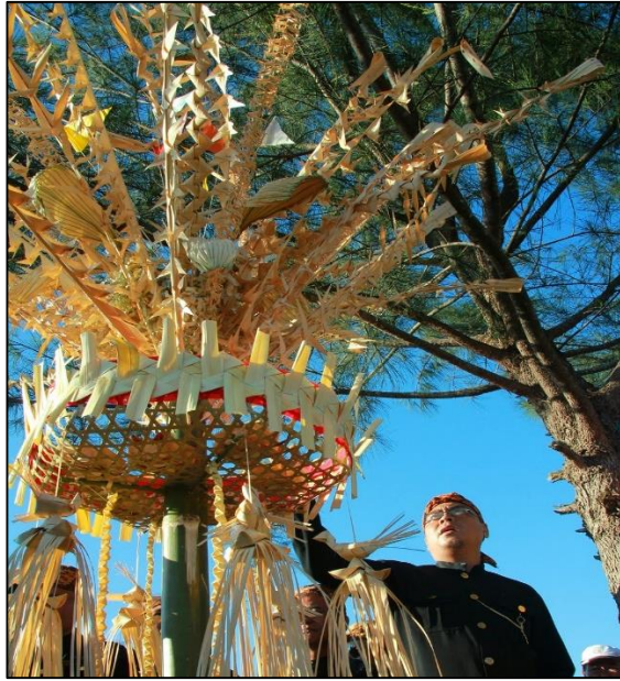
Gambar 1.1 : Serahang Kakan Kaul merupakan seni tradisi kaum Melanau di Mukah, Sarawak.