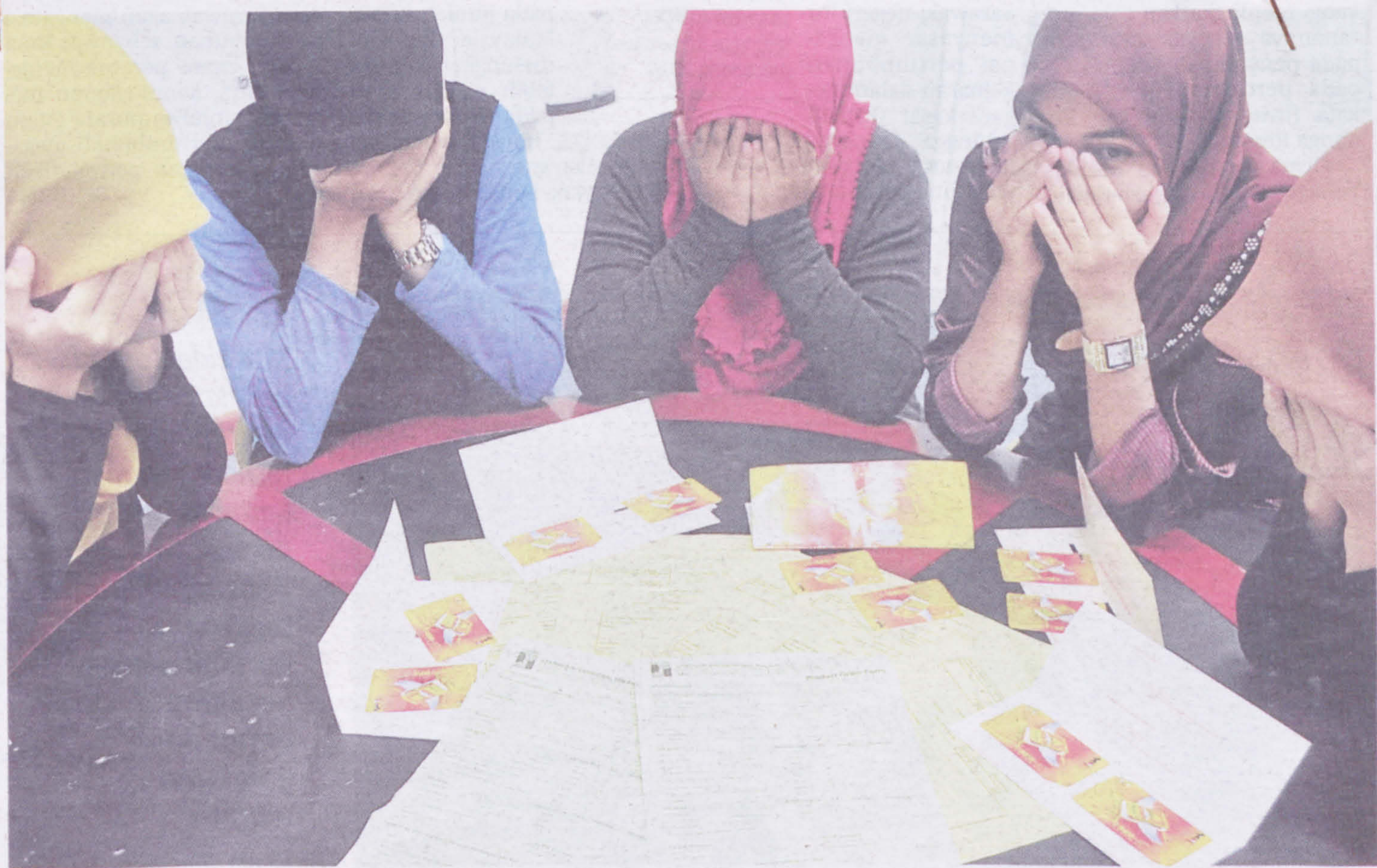
Antara 20 pelajar UNIMAS dan UiTM yang menjadi mangsa sindiket penipuan pelaburan skim portal di Kota samarahan, semalam.