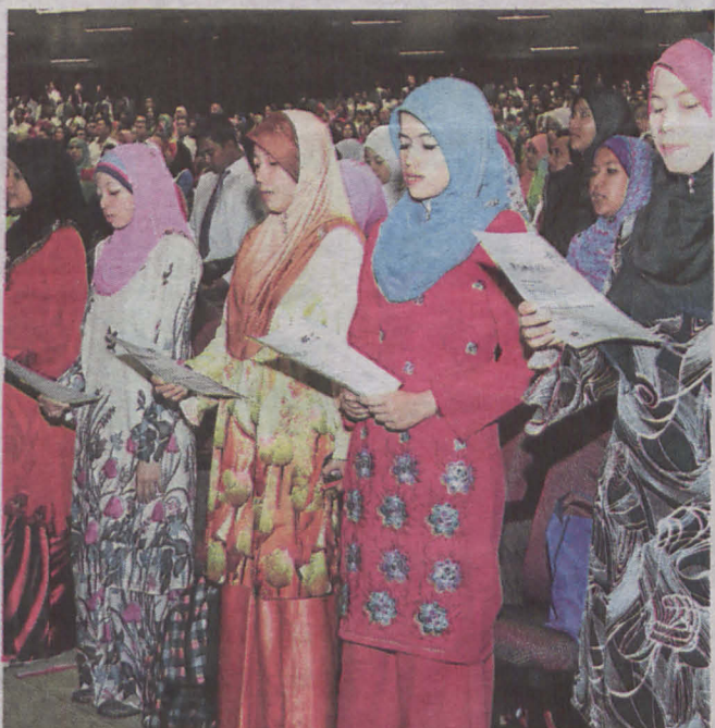
Sebahagian daripada pelajar membaca ikrar bersempena dengan majlis siswa dan ikrar pelajar baru Program Jarak Jauh, di Dewan Tuanku Syed Putra, Universiti Sains Malaysia.

"Promosi dan penjenamaan USIM yang menawarkan sistem pengajian yang mengintegrasikan ilmu naqli dan aqli dalam silibus akademik kepada masyarakat berjaya memberi impak yang besar," katanya.