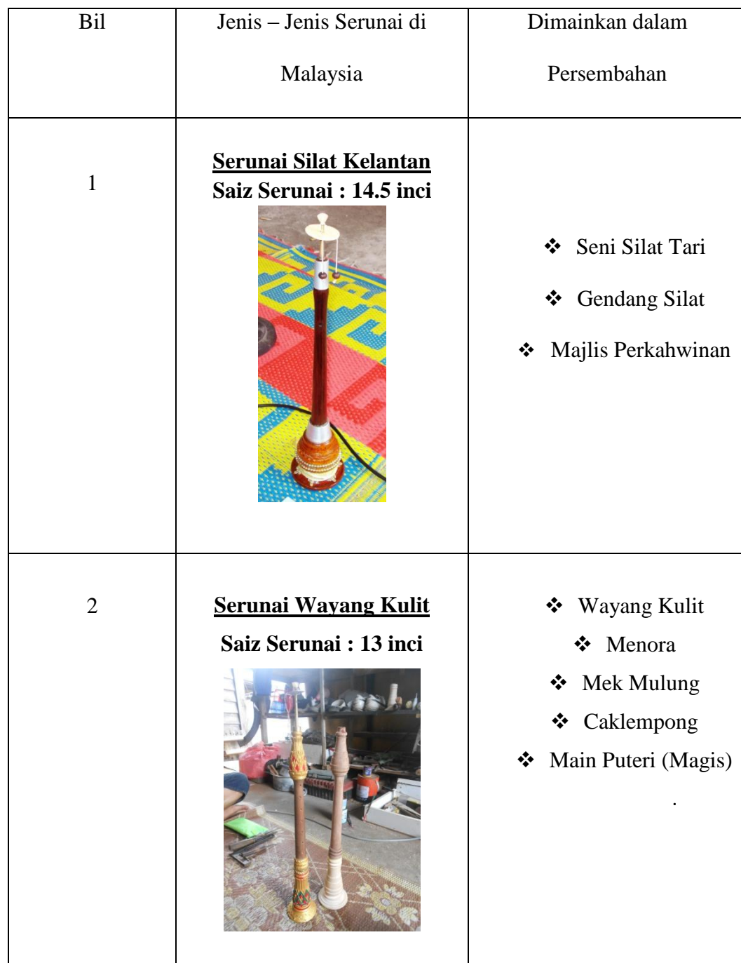
Jadual 1 : Senarai jenis-jenis serunai di Malaysia serta persembahan