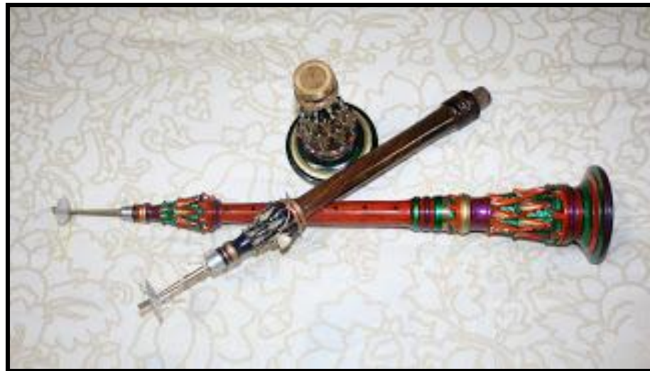
Rajah 1 : Alat Muzik Tradisional Serunai Kelantan

Menurut Portal Rasmi Perbadanan Kemajuan Kraftangan Malaysia, Serunai Kelantan adalah sejenis alat muzik dalam kumpulan muzik tradisional Melayu dan merupakan salah satu daripada alat muzik utama dalam