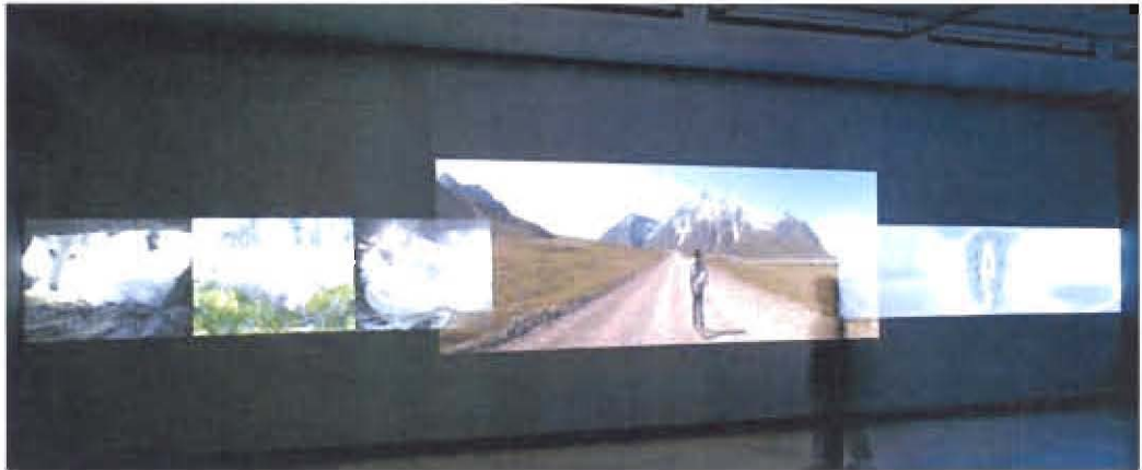
Gambar 2: Circannual Rhythm (pibloktok) 2003