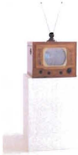
Gambar 1: Antique TV Fish 1986

Nam June Paik dilahirkan Seoul, South Korea pada 20 Julai 1932. Beliau bekerja dengan pelbagai media dan dianggap sebagai pengasas seni video. Dia dianugerahkan dengan penggunaan awal (1974) istilah " electronic super highway " dalam permohonan untuk telekomunikasi. Beliau memulakan kariernya dalam bidang seni apabila menamatkan pengajiannya di University of Tokyo dan Ludwig Maximilian University of Munich. Pada tahun 1965, Sony memperkenalkan Portapak dan dari sini beliau mula menjadi selebriti antarabangsa yang terkenal dengan kerja-kerja kreatif dan menghiburkan beliau.