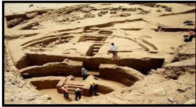
Gambar4 : Seni Arkeologi

Perkataan arkeologi ini dikatakan berasal daripada bahasa Yunani iaitu archaeo yang bererti "kuna" dan logos , yang membawa maksud "ilmu". Ia juga dipanggil sebagai ilmu mengenai sejarah kebudayaan bagi sesuatu barangan. Ilmu bagi mempelajari sesuatu budaya (manusia) pada masa lalu melalui kajian sistematik ke atas data objek atau benda yang ditinggalkan juga dikatakan sebagai arkeologi. Oleh yang sedemikian, arkeologi seni dapat dikatakan sebagai sebuah kajian yang membahas tentang benda-benda peninggalan di masa lampau yang memiliki unsur dan nilai seni pada bentuk dan wujudnya.