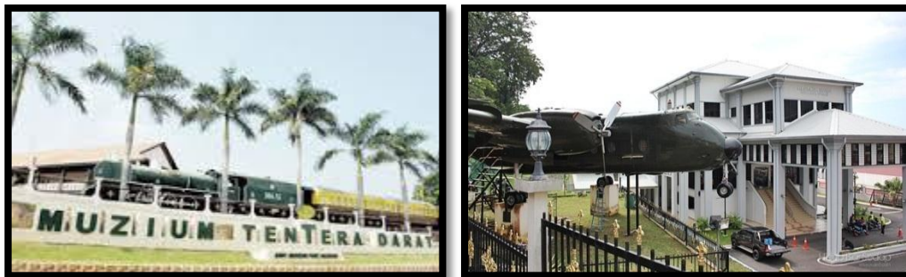
Gambar 1 : Muzium Tentera Darat (TD)

Sejak tahun 1989, ilham penubuhan Muzium Tentera Darat telah tercetus dan komitmen Tentera Darat dapat dilihat dengan pemilihan Port Dickson sebagai lokasi bersempena tempat kelahiran Tentera Darat yang pertama dan Tentera Darat terus gigih merealisasikan usaha dan impian untuk mendirikan sebuah muziumnya yang tersendiri. Pada 28 Jun 2005, Seri Paduka Baginda Yang Di-Pertuan Agong Ke-XII telah menyempurnakan acara perasmian Muzium Tentera Darat.