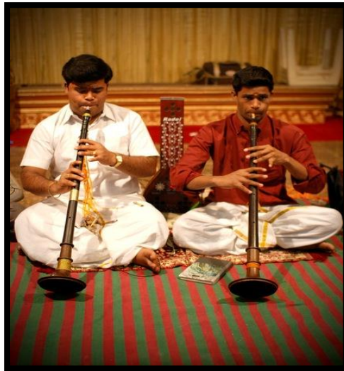
Gambar 3 : Seni Muzik

Terdapat beberapa pengertian muzik yang telah diwujudkan oleh segelintir ahli sasterawan, antaranya adalahmusik terdengar urutan logis tapi tidak logika argumen, musik adalah seperangkat vitalitas, impian campuran suara yang bersatu dan mengkristalisasi. (Irwin Edman, filsuf)