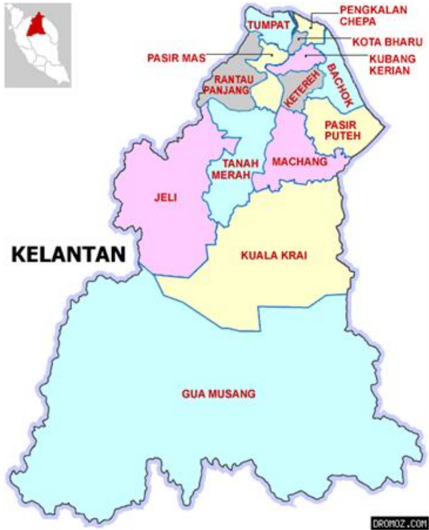
Peta: 1.1.1 Peta Negeri Kelantan