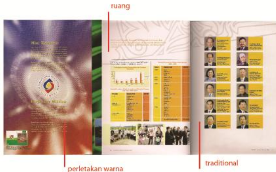
Gambarajah 1: Contoh buku laporan tahunan Unimas.

Dalam buku laporan tahunan universiti, perletakan visual seperti warna, susunan reka letak, diagram, carta-carta yang disenaraikan tidak sesuai dengan konsep dan masih tradisional. Penggunaan grafik seperti garisan, ruang, dan saiz perkataan yang diguna amat mengelirukan mata pembaca.