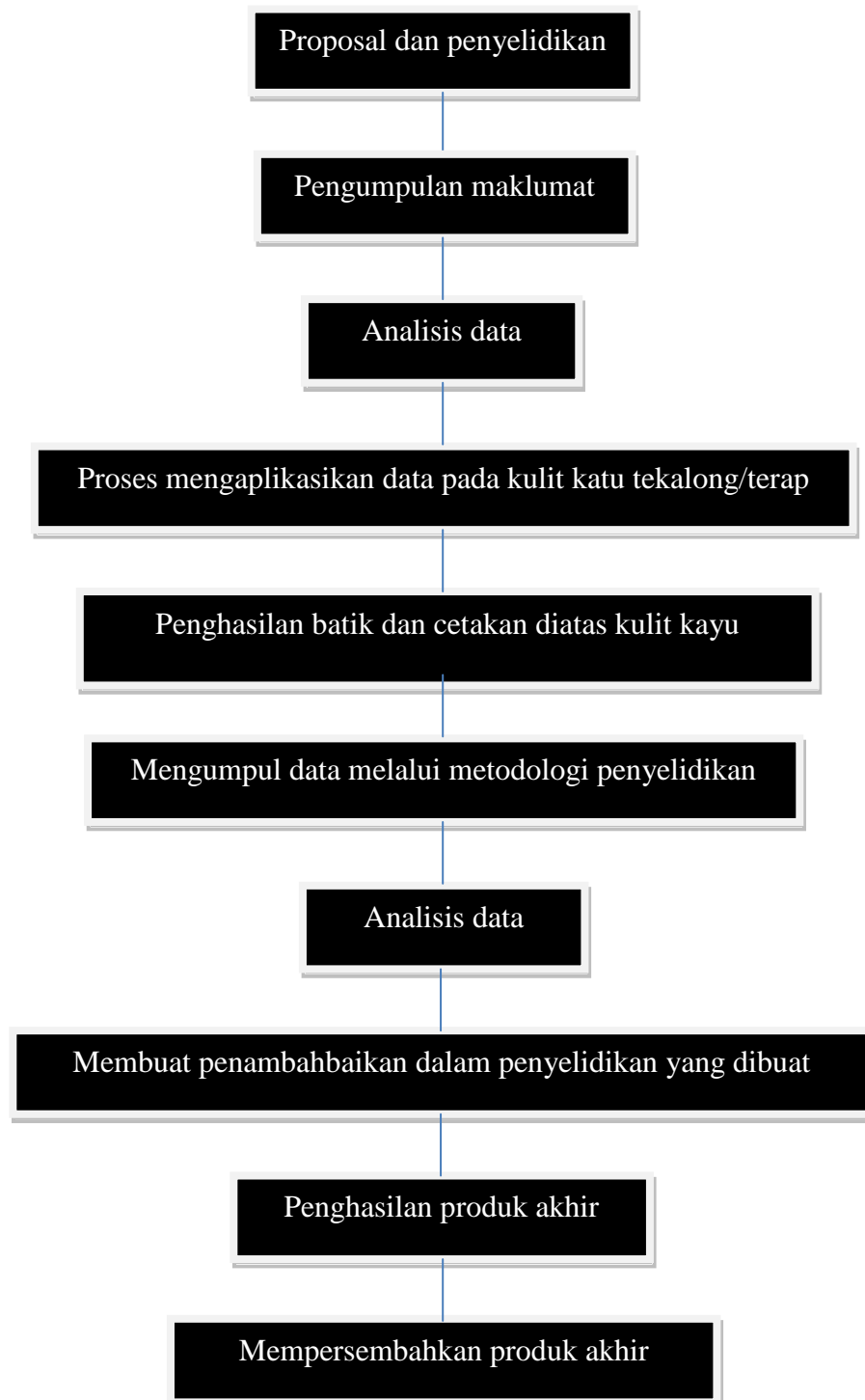
Rajah 1.5 : Carta perancangan kerja