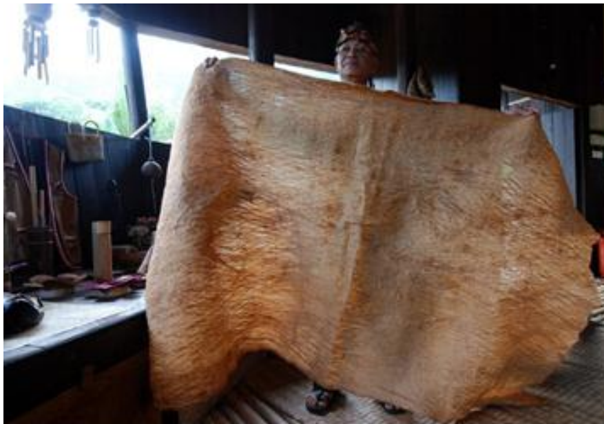
Rajah 1.1 : Kulit kayu Tekalong yang telah diketuk

Pokok Tekalong atau dalam bahasa Malaysia dipanggil terap. Selain itu, pokok ini juga tergolong dalam pokok jenis Artocapus seperti pokok sukun, cempedak dan nangka. Ia merupakan tumbuhan liar yang mempunyai banyak kegunaannya kepada manusia terutamanya pada bahagian kulit. Di Sarawak suku kaum seperti Iban dan Bidayuh memproses kulit kayu ini bagi menghasilkan barangan kegunaan harian ataupun tujuan keagamaan seperti pakaian, beg, tikar, dinding dan sebagainya 1 . Manakala di Semenanjung Malaysia juga, kulit kayu ini turut digunakan oleh kaum orang asli untuk dijadikan pakaian. Sifat kulit kayu Tekalong ini yang kasar dan berbeza ketebalannya menjadikan ianya istimewa.