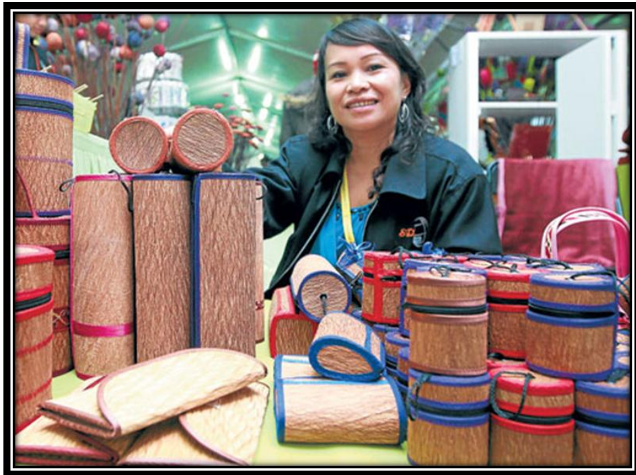
Rajah 1.4 Produk kulit kayu yang berada di pasaran tempatan

Dari segi nilai estetika, pengkaji ingin menghasilkan produk kulit kayu yang berkonsepkan kontemporari dengan mengekalkan tekstura kulit kayu yang asli. Pengaplikasian teknik tekstil pada kulit kayu merupakan satu nilai tambah dalam penghasilan produk kraftangan. Produk kulit kayu dipasaran tidak mempunyai rekacorak dan tidak berwarna (rujuk rajah 1.4). Oleh itu penyelidik ingin membuat kajian bagi menghasilkan produk kulit kayu yang mampu menarik minat masyarakat untuk memilikinya, terutamanya dalam golongan muda masa kini.