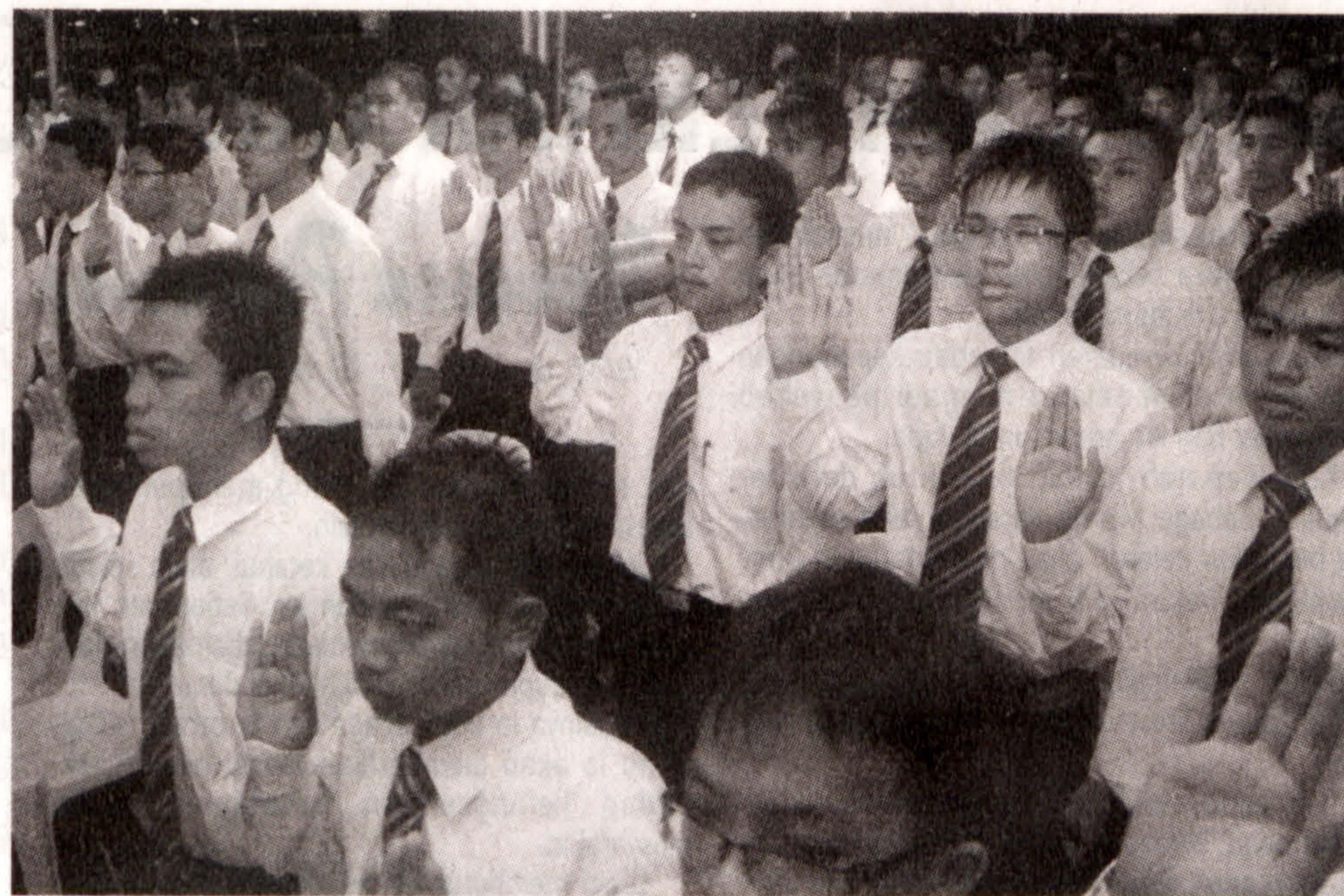
SEMANGAT ... Pelajar Unimas bersemangat ketika melafazkan ikrar.