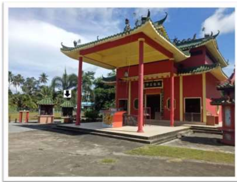
Gambar 1: Tokong Cina yang mempunyai tempat Datuk Kong (ditanda) di Kampung Buntal, Kuching.