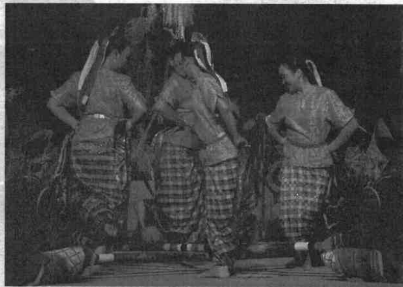
Masyarakat Kenyah kaya dengan kebudayaan tradisional.

konsonan, maka suku kata "Pe" akan digunakan. Contohnya nama individu seperti Asang, Bungan, Balan, Eno, Libut, Urai, Uyang dan Jalong akan menjadi Pasang, Pebungan, Pebalan, Peno, Pelibut, Purai, Puyang dan Pejalong.