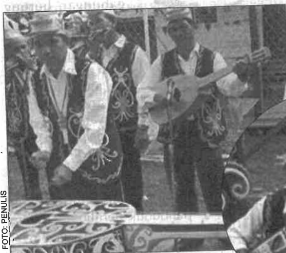
Persembahan oleh Kumpulan Kebudayaan Kenyah Uma Bakah semasa menyambut Hari Kemerdekaan.