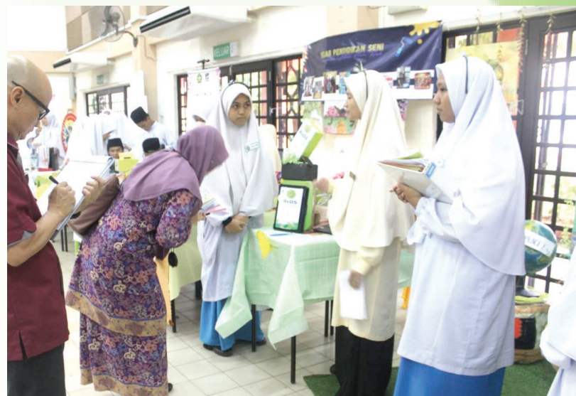
PARA juri tekun mendengar penerangan tentang penciptaan dan penggunaan ReDS daripada ahli PALS.

Beliau berharap aktiviti kitar semula bahan sisa ini bukan sekadar untuk pertandingan atau untuk menjana pendapatan kelab, tetapi juga untuk dijadikan amalan dalam kehidupan seharian demi kelestarian alam sekitar dan bumi ini.