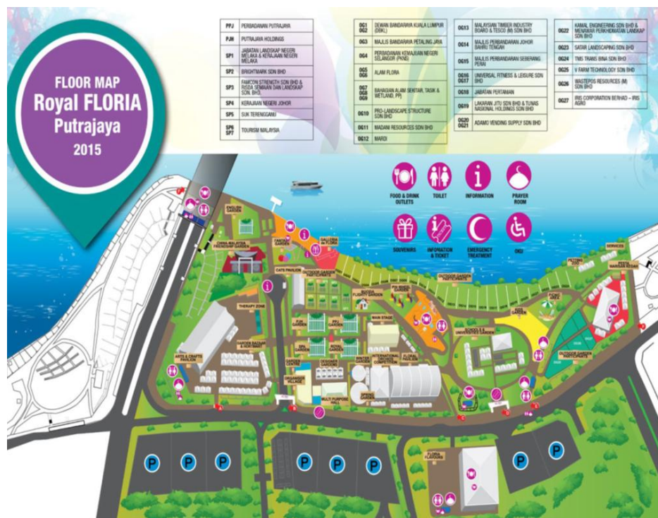
Peta 1.2: Plan lokasi Anjung Floria

Kini, Festival Floria Diraja menjadi edisi ke Sembilan dalam pameran bunga semenjak penubuhannya pada 2007. Acara tahunan dianjurkan oleh entiti induk Perbadanan Putrajaya dengan kerjasama Ministry of Federal Territories . Buat kali pertama pada 2014, bunga dan pesta taman ini menyaksikan penyertaan pelbagai badan kerajaan dan badan korporat sebagai rakan-rakan pintar yang menyumbang ke arah kejayaan acara.