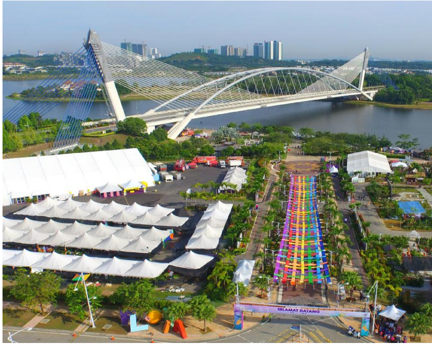
Peta 1.3: Lokasi sebenar Anjung Floria Putrajaya