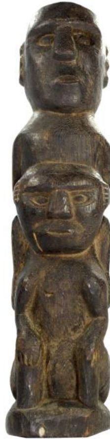
Gambar 1.3: Patung ukiran kayu dari kawasan Sepik, Papua New Guinea yang menggambarkan semangat nenek moyang.

Dalam kajian beliau, Chong (1987) turut mendapati kraf belum sangat menyerupai ukiran seni primitif Pasifik dari segi material, teknik ukiran, ekspresi, fungsi dan rupa. Bagi seni ukiran tradisional seperti belum, Dutton (1998) menjelaskan apa-apa seni atau artifak yang dicipta oleh orang asli sesuatu tempat adalah didefinisikan sebagai seni etnografik. Seni etnografik terdapat dalam bentuk lukisan, topeng atau arca berukir yang dibuat untuk ritual sesuatu kepercayaan.