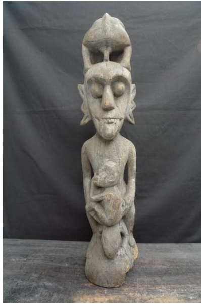
Gambar 1.1: Patung belum dalam posisi duduk.

Identiti belum dikenal pasti melalui ukirannya seperti bentuk perhiasan di kepalanya, kedudukan tangan dan kaki sama ada duduk, berdiri atau mencangkung, kaki melunjur, tangannya menahan lidah atau berpeluk tubuh. Belum juga mempunyai jantina dan ia dikenalpasti melalui rambutnya yang panjang dan duduk dalam posisi bersimpuh (Chong, 1978).