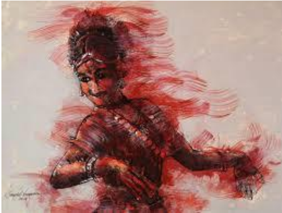
Fig 4: Expression VII (2014) Artis : Sivarajah Natarajah Dimensi : 55cm X 75cm Media : media campuran atas kanvas

Pengkaji mendapati kebanyakannya karya Sivarajan menonjolkan ekspresi muka, pergerakan tangan dan lenggokan gerak badan. Selain itu, beliau gemar menggunakan pergerakan dalam tarian odissa untuk menghasilkan lukisan dan karya fotografi. Manakala pengkaji bercadang untuk mengeksplorasi pergerakan kaki yang bergelang salangai dalam tarian bn untuk melihat ekspresinya secara visual.