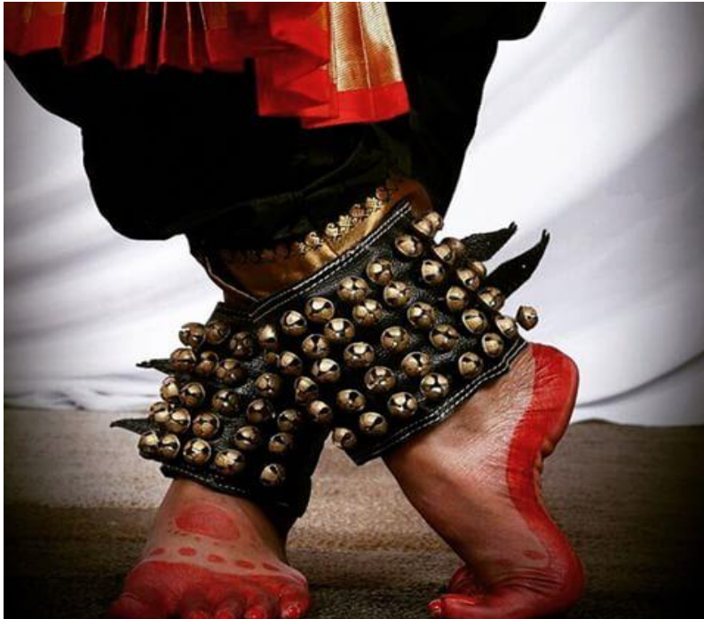
Fig. 1 : Salangaiyin Ozhiye Veadham(2007)

Dalam Tarian bn terdapat dua jenis pergerakan iaitu abstrak dan ekspresif. Pergerakan abstrak dilakukan untuk menunjukkan irama, memberikan hiasan, dan mencipta kecantikan serta tidak ada tujuan hanya bergerak demi kepentingan sendiri. Pergerakan ekspresif menyampaikan makna dan menunjukkan emosi melalui pergerakan tangan, kaki, badan dan wajah. Pergerakan ini menggambarkan tema atau perasaan, dan menghantar pengalaman menari kepada penonton. Menurut Rangashree (2008), pergerakan bharata natyam adalah unik kerana tarian ini berkongsi unsur dengan tarian India klasik yang lain, tetapi tidak ditemui dalam gaya tarian barat. Tarian bn sering digambarkan sebagai geometri, kerana terdapat banyak pergerakan geometri. Tarian ini dinamik, bertenaga dan seimbang. Terdapat beberapa pergerakan dalam tarian bn ini. Antaranya ialah ;