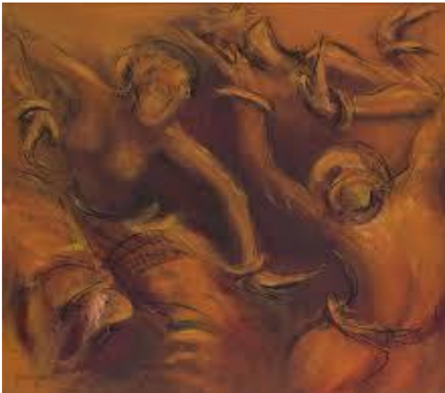
Fig 3 : Shakti (1996)

Kebanyakan karya beliau menggunakan objek budaya yaitu tarian tradisional India yang menunjukkan ekspresi terperinci gerakan serta aksoseri penari tradisional. Pengkaji menggunakan pendekatan yang hampir sama yaitu mengekspresikan pergerakan kaki yang bergelang salangai dalam bentuk visual. Shakti ( 1996) dan Expression VIII (2014) adalah antara contoh karya beliau.