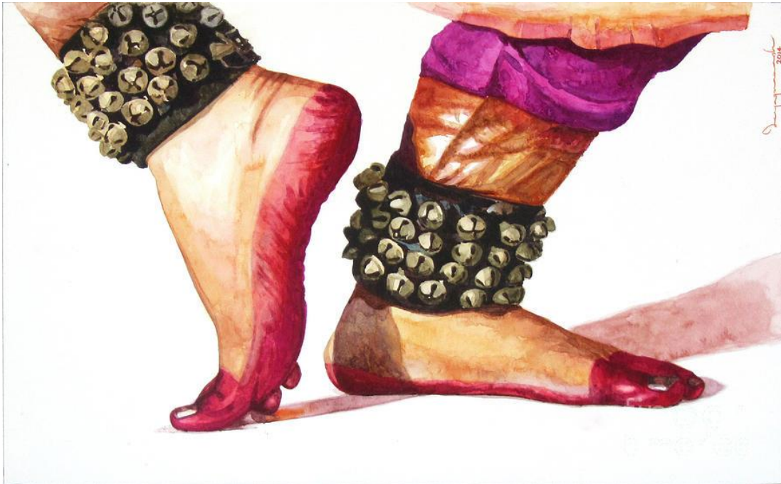
Fig. 5: Rhythm Of Salangai (2016), Artis : Jeyaprakash M Media : Cat air atas kertas

satu pergerakan kaki dalam tarian Bharatanatyam dengan memakai Salangai. Beliau menjadikan salangai sebagai subjek utama yang difokuskan dalam lukisannya.