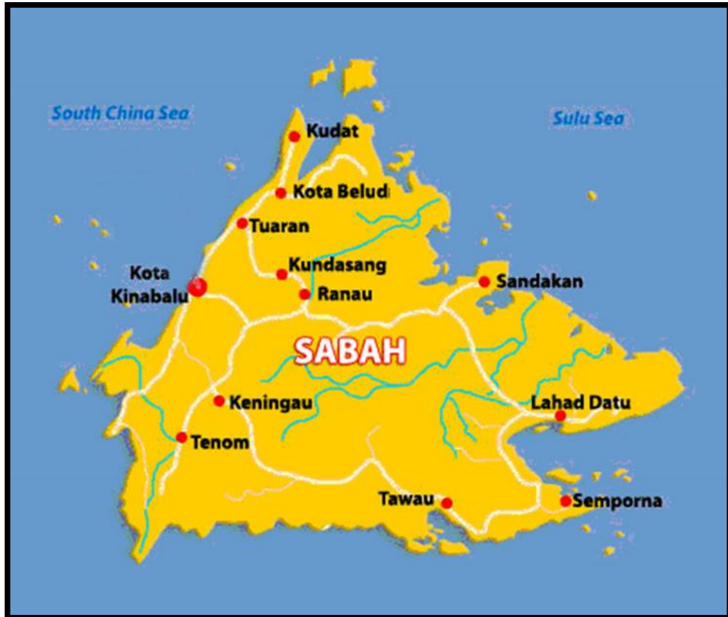
Gambar 1.1 : Peta Negeri Sabah