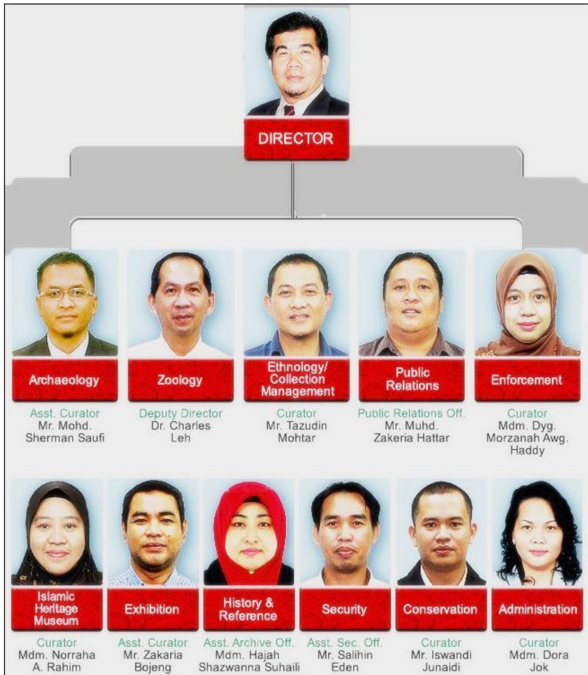
Carta 1 : Organisasi muzium Tun Abul Razak, Kuching Sarawak (2014)

Sumber : Laman Rasmi Muzium Tun Abdul Razak