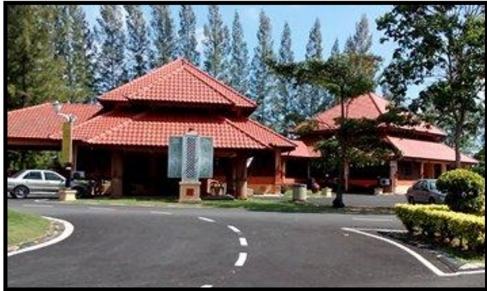
Gambar Rajah 1.1: Muzium Bugis Pontian