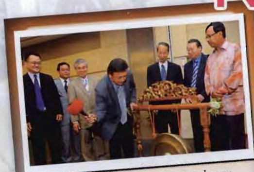
Ketokohan dan pengalaman Langgu dibukukan