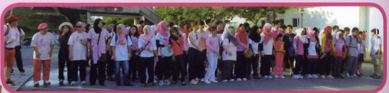
The participants ready at the starting point for the flag off.