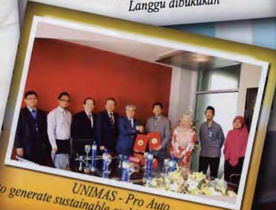
UNIMAS - Pro Auto to generate sustainable and innovative technology