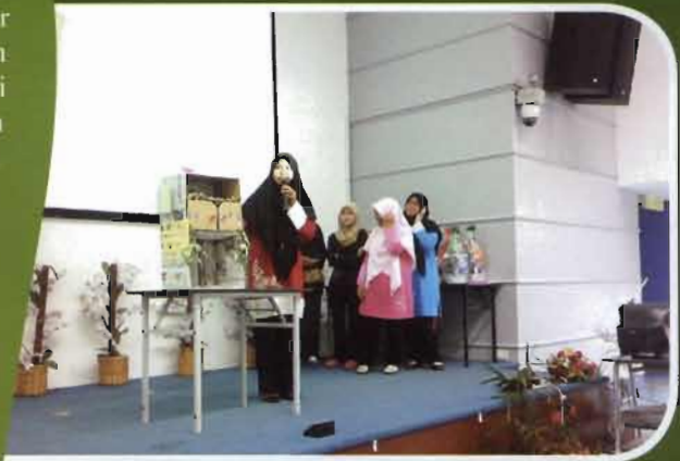
Prototaip kumpulan ‘Lot 77-Aras 4’ iaitu almari buku.