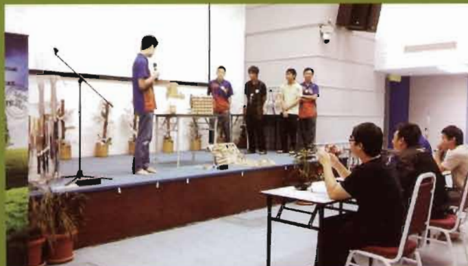
Kumpulan ‘Sebayor 301’ membentangkan prototaip mereka yang menggambarkan suasana persekolahan.

Secara keseluruhannya, aktiviti ini bukan sahaja mampu meningkatkan kesedaran dan membina semangat mencintai alam sekitar tetapi juga dapat mengeratkan silaturahim antara peserta dan ahli jawatankuasa pengelola. Dengan berbekalkan semangat, pengetahuan umum, dan kesedaran yang tinggi, ahli-ahli jawatankuasa pengelola telah menjayakan program ini sebagai menyahut kempen “Go Green” yang telah dijalankan oleh pihak UNIMAS di kampus barat.