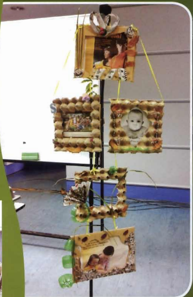
Bingkai gambar yang dihasilkan oleh kumpulan ‘Wonderwoman’.