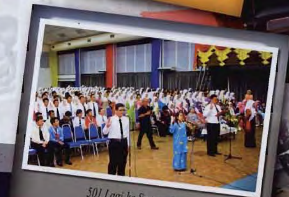
501 Lagi ke Samarahan