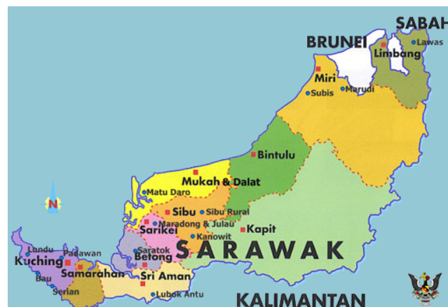
Gambar rajah 1.5.2: Peta Negeri Sarawak

Pengkaji akan menjalankan kajian berdasarkan kepada kaum Melayu yang beragama Islam. Hal ini kerana bidang yang dikaji oleh pengkaji adalah berkaitan dengan kesenian Islam. Lokasi kajian yang dipilih oleh pengkaji adalah di Sarawak iaitu di Jabatan Agama Islam Sarawak. Pengkaji juga memilih JAIS kerana kaligrafi khat adalah merupakan salah satu produk atau kesenian yang ada dalam badan tersebut. Selain itu, pengkaji juga akan menggunakan informan iaitu masyarakat yang mahir dalam membuat kaligrafi khat iaitu pekerja yang berkhidmat dalam badan tersebut sebagai informan untuk pengkaji mendapatkan data atau maklumat dalam proses pembuatan bidang kajian tersebut. Hal ini kerana mereka adalah merupakan informan yang tepat untuk bekerjasama dengan pengkaji dalam memberikan data dan juga maklumat dalam bidang yang dikaji kerana informan-informan tersebut adalah semestinya orang yang berpengalaman yang bidang tersebut.